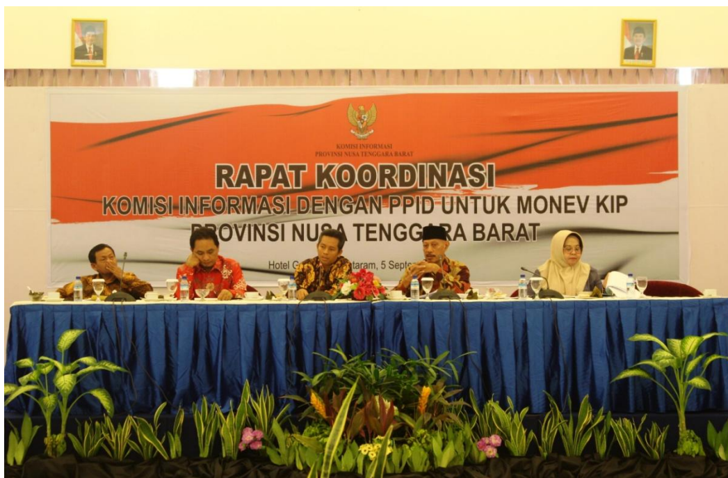
(Foto Rapat Koordinasi Komisi Informasi dengan PPID untuk Monev KIP 2019)