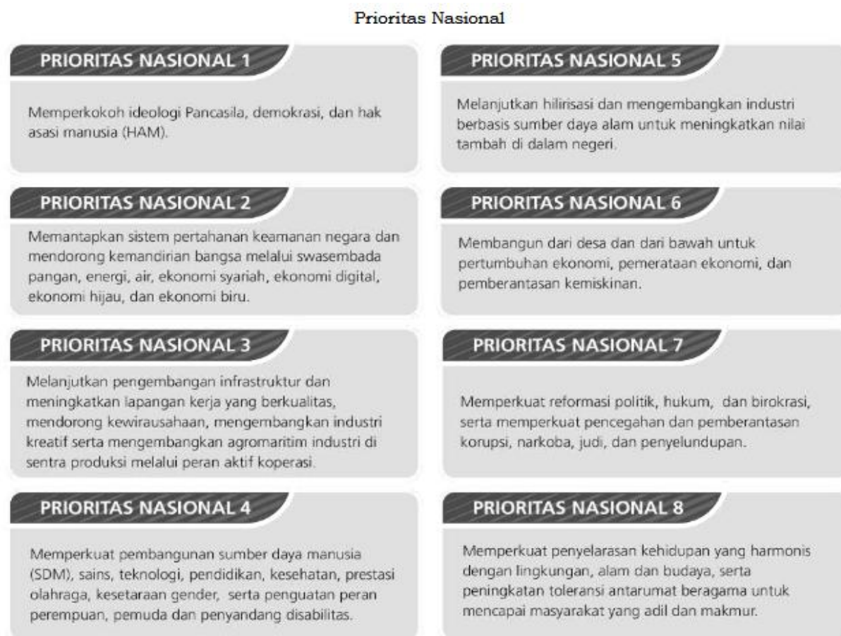
Gambar 2. 2 Prioritas Nasional

Adapun target indikator yang ingin dicapai di tahun 2025 adalah sebagai berikut.