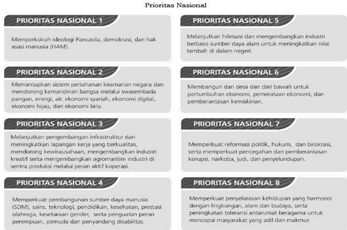
Gambar 2. 2 Prioritas Nasional

Adapun target indikator yang ingin dicapai di tahun 2025 adalah sebagai berikut.