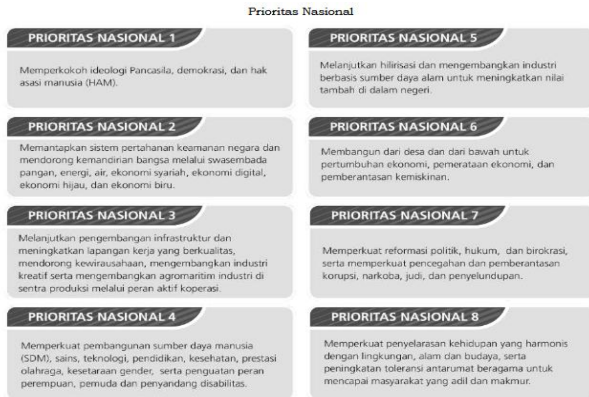
Gambar 2. 2 Prioritas Nasional

Adapun target indikator yang ingin dicapai di tahun 2025 adalah sebagai berikut.